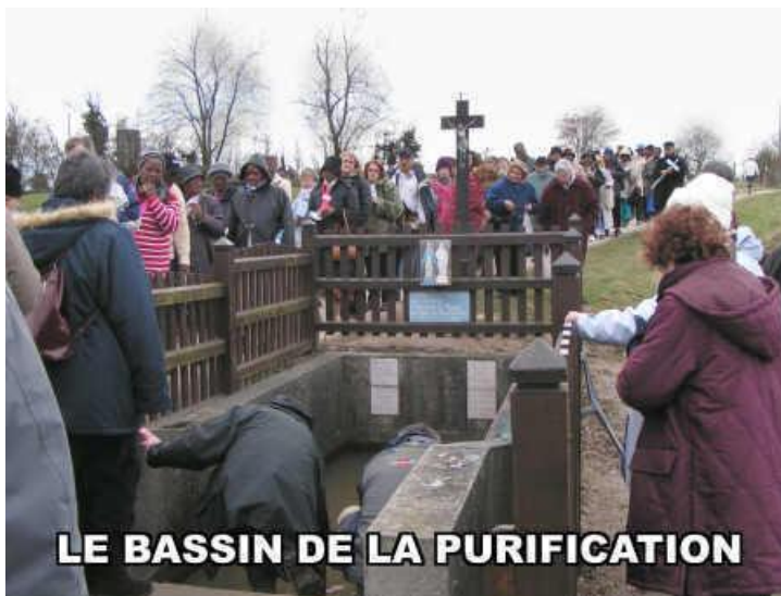
LE BASSIN DE LA PURIFICATION

Le 5 octobre 1973 à la Chapelle, Jésus ayant pris la place du Saint Sacrement, demande à Madeleine de proclamer :